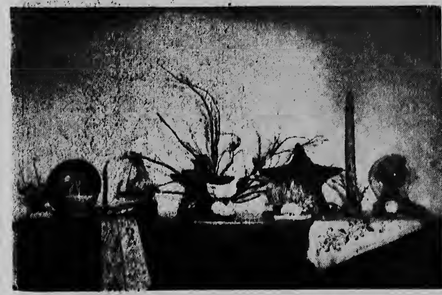
Maandag schreven wij reeds over het succes, dat de eerste inzamelingsmiddag van spoorwielhuislijstartikelen opleverde. In het kantoor van het Touristenbureau liggen de artikelen opgeslagen en onze fotograaf maakte er een plaatje van.

ORANJESTAD. — Dit vroeg de heer H. zich af, toen hij gisteren zijn huis op Dakota uitrustte en tot zijn ergernis ontdekte, dat een onverlaft zijn Chevrolet met een bijtende vloeistof mishandeld had, waardoor zijn mooie, wagen lelijk beschadigd werd. De heer H. heeft direct van het gebeuren aangifte gedaan bij de politie, die een onderzoek instelt.